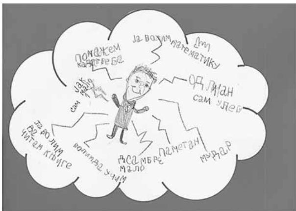
Слика 2. Мапа ума Моје снаге (А., дечак, 6 година)