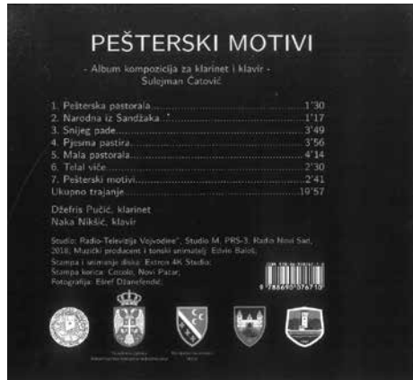
Слика 6. Садржај CD-а