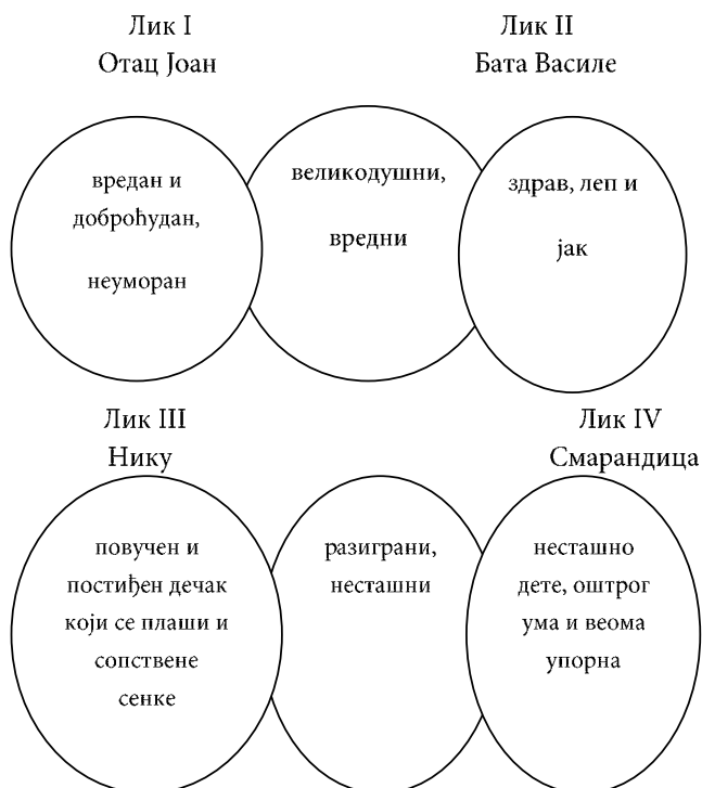
Слика 2. Анализа ликова из збирке за децу Сећања из детињства Јона Креанге помоћу Веновог дијаграма

Венов дијаграм је графичка метода која се реализује помоћу две делимично преклапајуће елипсе и погодна је за анализу књижевних ликова. У заједничком делу су приказане сличности међу ликовима, а у остатку кругова истакнуте су разлике. Ову методу користили смо у 4. разреду, након обраде текста Јона Креанге Сећања из детињства .