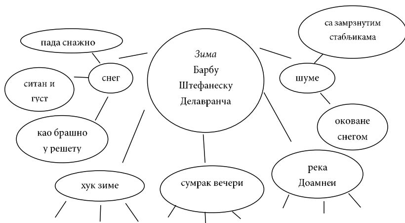
Слика 1. Примена методе „грозда“ 2 у анализи песмице Зима Барбу Штефанеску Делавранче

комуникације и односа са онима око себе, као и продубљивању континуитета учења (Мандру 2005).