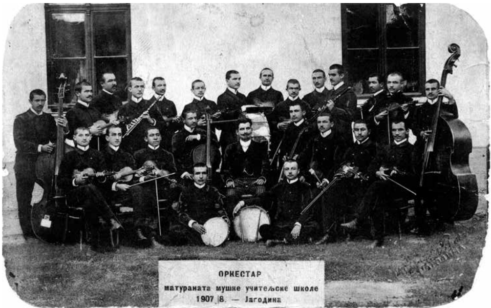
Слика 2. Оркестар матураната Мушке учитељске школе, Јагодина, школска 1907/8. година (Педагошки музеј у Београду, инв. бр. 793)